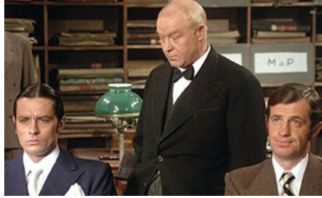
1969 BORSALINO de Jacques Deray avec Alain Delon, Jean-Paul Belmondo