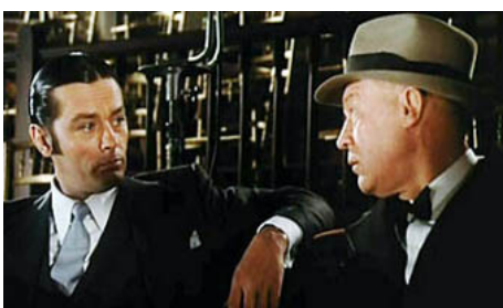
1974 BORSALINO & CO de Jacques Deray avec Alain Delon