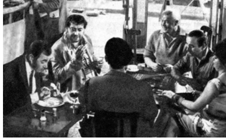
1965 PARIS AU MOIS D'AOÛT de Pierre Granier-Deferre avec Charles Aznavour, Michel De Ré