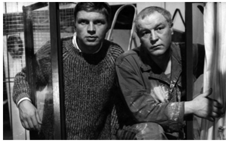
1962 LES DIMANCHES DE VILLE-D'AVRAY de Serge Bourguignon avec Hardy Krüger