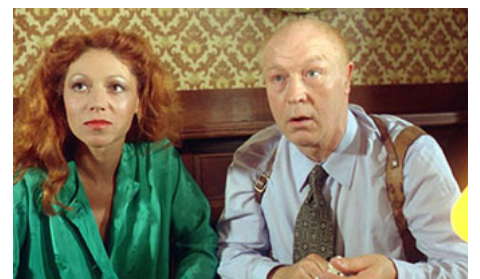
1977 LE JUGE FAYARD DIT «LE SHÉRIF» d'Yves Boisset avec Myriam Mézières