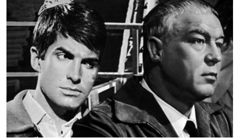
1965 L'HOMME DE MARRAKECH de Jacques Deray avec Georges Hamilton