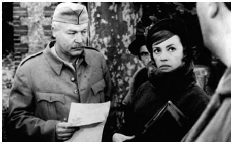
1963 LE JOURNAL D'UNE FEMME DE CHAMBRE de Luis Buñuel avec Jeanne Moreau