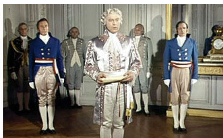
1954 NAPOLÉON de Sacha Guitry