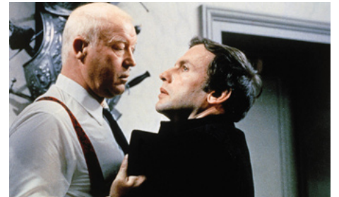
1972 L'ATTENTAT d'Yves Boisset avec Jean-Louis Trintignant