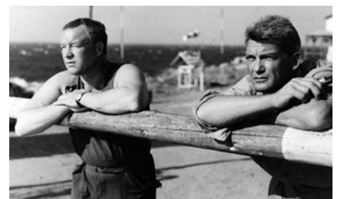
1956 S.O.S. NORONHA de Georges Rouquier avec Jean Marais