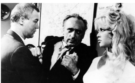
1958 LA FEMME ET LE PANTIN de Julien Duvivier avec Jacques Mauclair, Brigitte Bardot