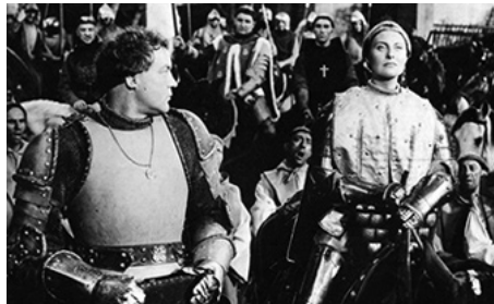
1953 DESTINÉES, partie Jeanne de Jean Delannoy avec Michèle Morgan