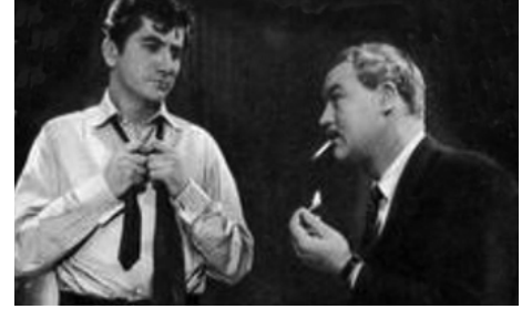
1952 LA NEIGE ÉTAIT SÂLE de Luis Saslavsky avec Daniel Gélin