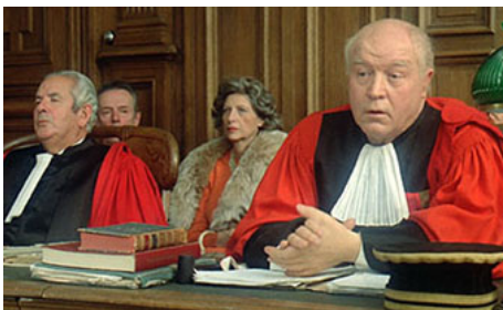
1972 L'AFFAIRE DOMINICI de Claude Bernard-Aubert