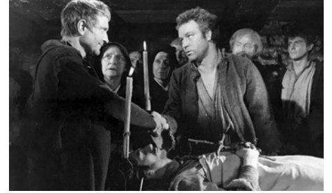
1950 DIEU A BESOIN DES HOMMES de Jean Delannoy avec Pierre Fresnay