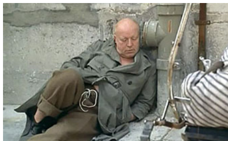
1973 LES GASPARDS de Pierre Tchernia