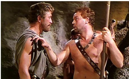
1953 ULYSSE (Ulysse) de Mario Camerini avec Kirk Douglas