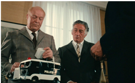
1971 IL ÉTAIT UNE FOIS UN FLIC de Georges Lautner avec Henri Cogan