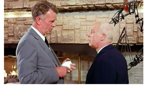
1971 LE SAUT DE L'ANGE d'Yves Boisset avec Sterling Hayden