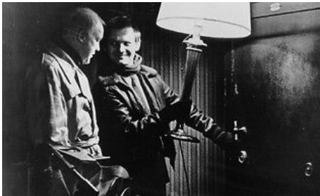
1967 MISE À SAC d'Alain Cavalier avec Philippe Moreau