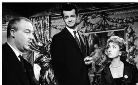
1958 MARIE-OCTOBRE de Julien Duvivier avec Serge Reggiani, Danielle Darrieux