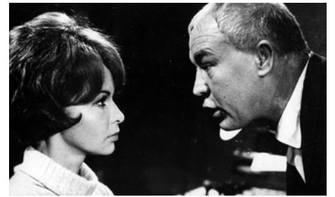
1963 À COUTEAUX TIRÉS de Charles Gérard avec Françoise Arnoul