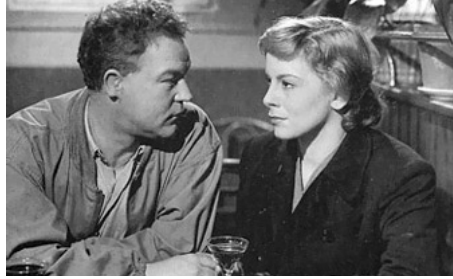
1952 RAYÉS DES VIVANTS de Maurice Cloche avec Christiane Lenier