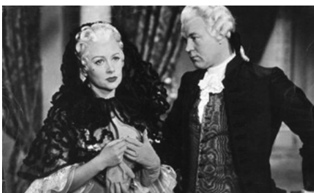
1954 MADAME DU BARRY de Christian-Jaque avec Martine Carol